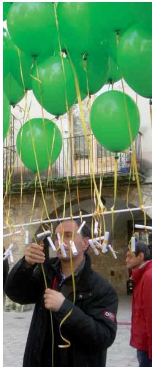
Els desitjos es van penjar als globus i es van enlairar cel amunt