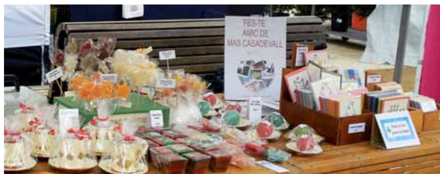
Parada de la fira de Nadal de Banyoles

U n any més, Mas Casadevall va posar la seva parada a les fires de Sant Narcís, a Girona, la diada de Tots Sants, i a la fira d'artesanía de Firastany, o fira de Sant Martí, entre el 18 i el 20 de novembre, al parc de la Draga. També va prendre part a la fira de Nadal de Banyoles, el 17 i 18 de desembre, on va tenir molt èxit l'espelma que duia incrustat un arbre de Nadal, així com les felicitacions de Nadal per pintar un mateix. ■