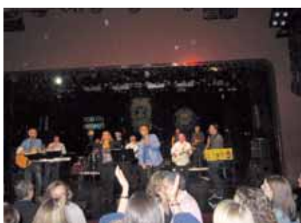
Un moment del concert a la sala Luz de Gas

21.30h. Sonen ja els primers acords, comença el concert. El punt culminant de mesos de correus electrònics i de setmanes venent entrades a tots els nostres