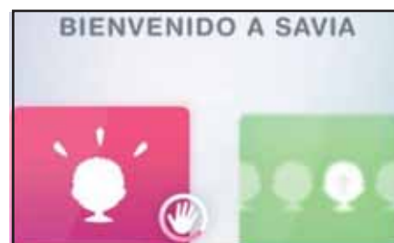
Logotip del projecte Savia impulsat per Indra

sentació a Barcelona d'aquesta aplicació, pensada per a mòbils intel·ligents. Activant el codi s'accedeix a unes seqüències de la vida quotidiana amb les quals el nen va adquirint rutines tan bàsiques com rentar-se les dents o les mans, seguir les instruccions d'una recepta o hàbits de comportament. Una de les característiques d'aquesta aplicació, com la resta de la fundació Orange, és que és totalment gratuïta, i respon a la filosofia de la fundació "que persones amb problemes de discapacitat ens proposin idees i solucions a problemes reals", explicava el director general de la fundació, Manuel Gimeno. I és que, continuava Gimeno, són les associacions les que, millor que ningú, saben el que necessiten.