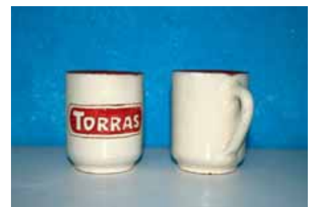
Les tasses reproduïxen el logotip de la coneguda fàbrica de xocolata de Cornellà de Terri