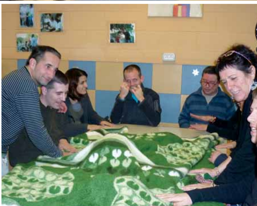
Fent 'cagar' el tió a la llar 1

Finalment va arribar la nit de Reis. Varem assistir tots a la Cavalcada de Banyoles, algun dels nois del centre va batre el rècord de recollida de caramels. Tot i que el Tió ja ens havia portat molts regals, els Reis van tenir la delicadesa de deixar-nos uns quants caramels a les portes de les Llars.