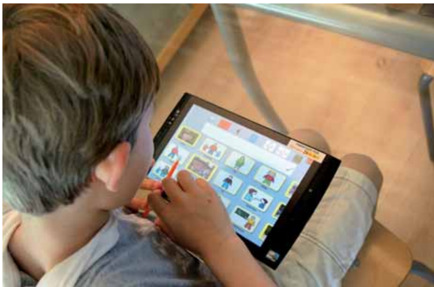
L'E-Mintza es basa en tecnologia tàtil i multimèdia i promou l'autonomia de la persona a través d'una agenda personalitzada

mes o lletres. A més, s'inclou l'opció d'afegir vídeos. Per a l'ús de l'eina, el programa es compon de dues aplicacions: d'una banda, "genera" un tauler de comunicació amb diverses categories bàsiques, de manera que al prémer sobre cada categoria s'obre una nova pantalla en la qual es presenten una sèrie de pictogrames, cadascun amb un so associat, i, al prémer en cada pictograma, la veu envia el missatge directe a una pissarra, que construeix la frase. Per exemple, en la categoria d'àpats, s'ofereixen diferents plats i aliments i l'usuari pot triar entre tots ells (representats per fotografies o pictogrames).