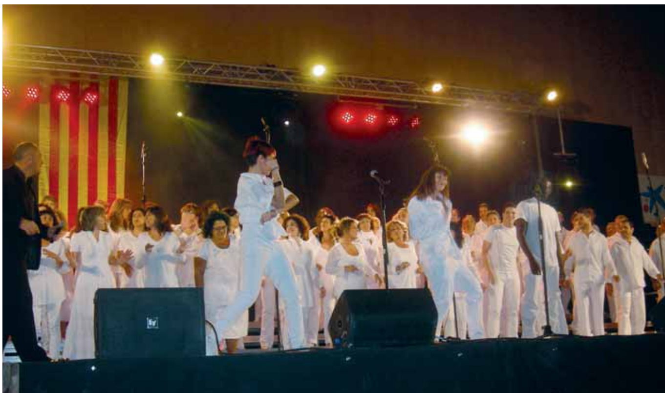
Detall d'un moment del concert de Gospel

Organitzar l'acte implicava assumir la major part de les despeses: el tècnic de so, els tècnics de llum, les assegurances, la tarima per col·locar més de 80 persones dalt l'escenari, la publicitat, els tickets, donar d'alta l'activitat a ServiCaixa, demanar el permís a l'SGAE, a l'Ajunta-