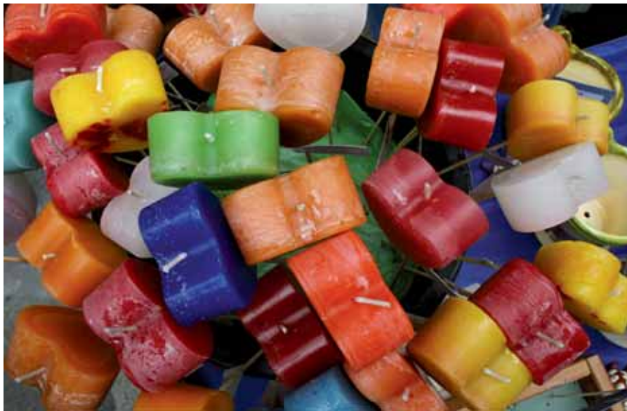
Ceras Roura facilita tot el material per fer les espelmes