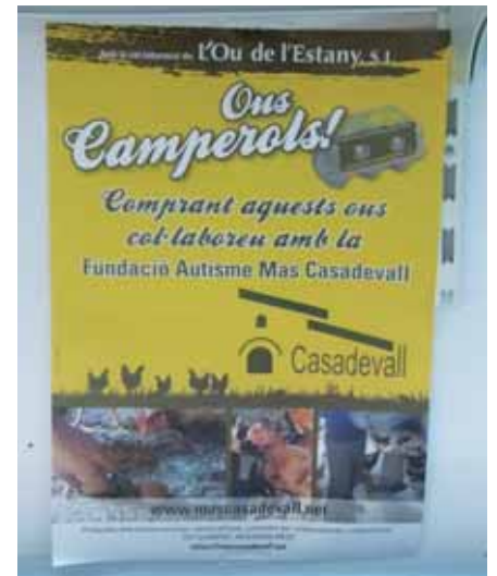
Cartell d'Ou de l'estany col·locat en un establiment col·laborador

Juntament amb aquestes dues empreses, no es pot oblidar que són moltes les comandes puntuals que fan els particulars d'articles de record o invitacions de casaments i batejos, i els encàrrecs d'ajuntaments, com els de morters per a la fira d'all de Cornellà de Terri, postals nadalenques o plats commemoratius de curses populars. ■