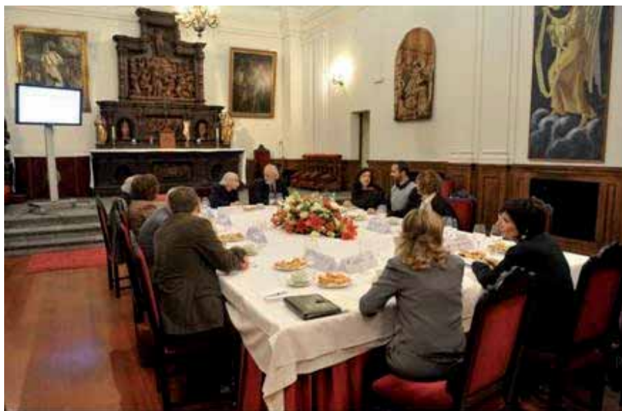
Desayuno de Giacomo Rizzolatti, Premio Príncipe de Investigación Científica y Técnica 2011, con científicos españoles en el edificio histórico Universidad de Oviedo.

En la trobada es va abordar l'autisme des de diferents perspectives: l'origen d'aquest trastorn del desenvolupament, l'augment del nombre de casos en nens i