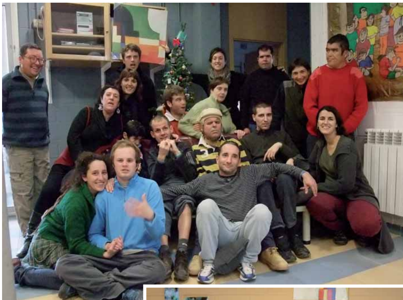
Nois i educadors van viure un Nadal entranyable