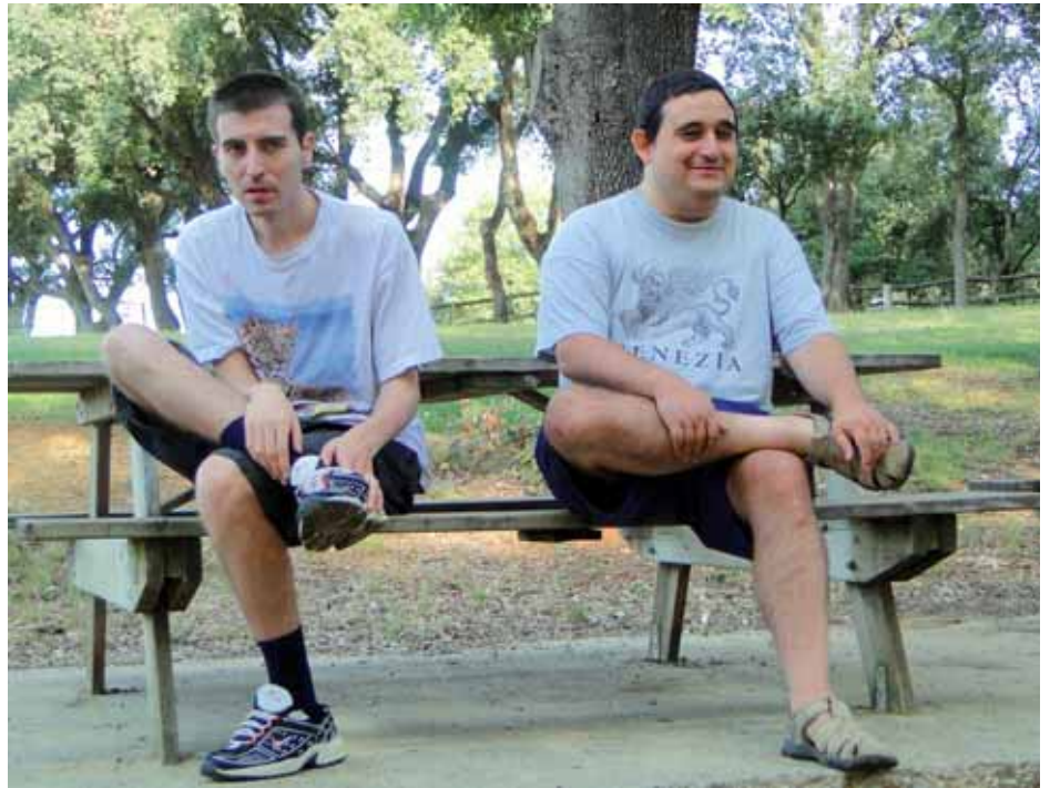
Una de les imatges presentades al concurs d'INICO

El segon és el concurs de fotografia digital del Instituto Universitario de Integración en la Comunidad (INICO), de la universitat de Salamanca, Les persones amb discapacitat a la vida quotidiana, Premio Fundación Grupo Norte. En tots dos casos es volia visualitzar amb normalitat la realitat del col·lectiu de persones amb discapacitat psíquica, física, sensorial o amb malaltia mental. ■