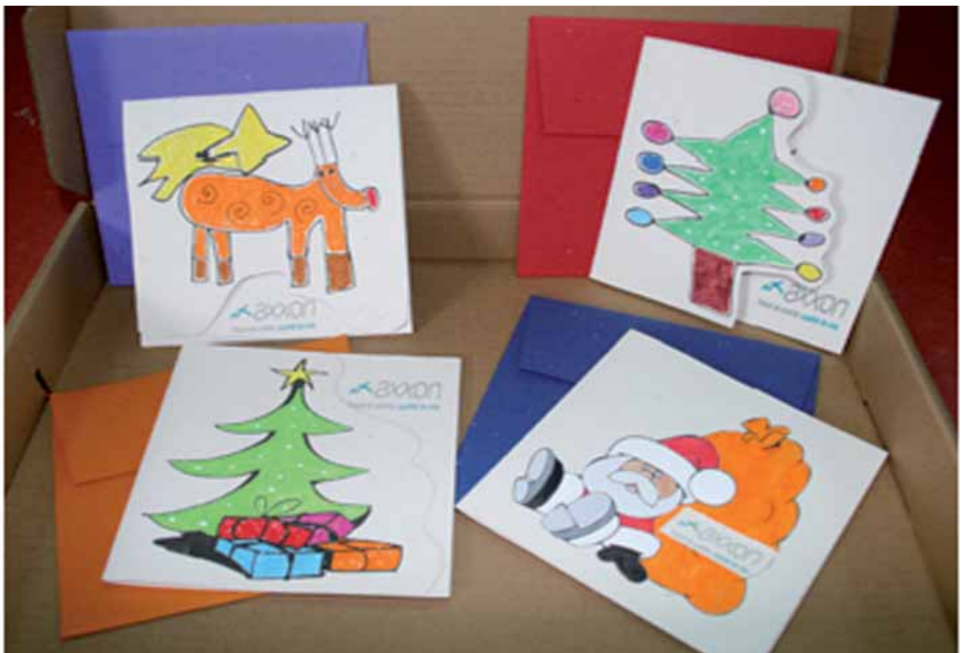
Diferets postals realitzades pels nois/es de Mas Casadevall

El dia de Nadal eren molt poquets els presents a les llars. De tota manera celebrem igualment la festivitat i sobretot l'àpat, que volem que sigui molt especial, cosa que sempre s'aconsegueix. ■