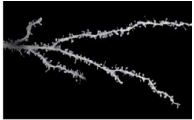
Neurona de una persona joven con autismo. (Foto: Guomei Tang y Mark S. Sonders/ Columbia University).

A pesar de los efectos adversos de la rapamicina, estamos ante un hallazgo esperanzador porque "el hecho de que podamos ver los cambios en el comportamiento que produce sugiere que el autismo puede todavía ser tratable después de que se diagnostica a un niño, si logramos encontrar un medica-