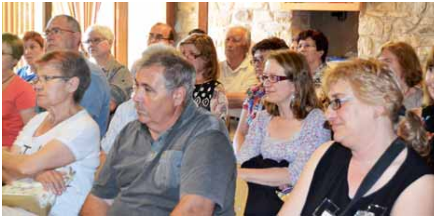
Les trobades són l'ocasió per conèixer l'evolució del centre

activitats realitzades durant l'estiu i les pre- vistest per a la temporada de tardor i hivern.