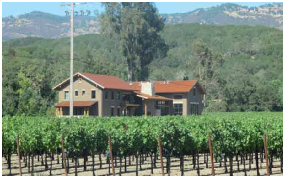
Campos de cultivo de viña en California

Los investigadores relacionaron los datos sobre el uso de estos compuestos con el lugar de residencia de las participantes durante el embarazo. Así, aproximadamente un tercio de las mujeres había residido, durante la gestación de sus hijos, a menos de 1,5 kilómetros de cultivos tratados con pesticidas. El grupo estudiado incluía a familias con niños de entre 2 y 5 años de edad a quienes se les ha diagnosticado au-