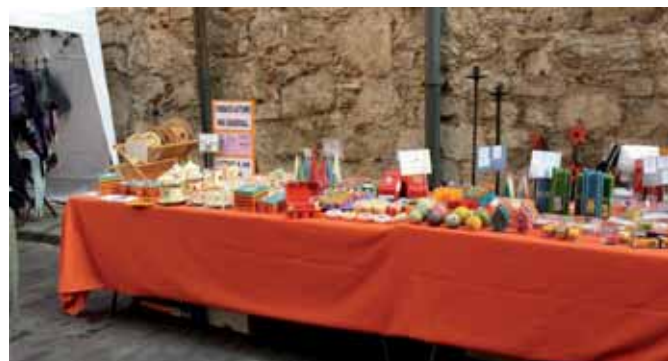
La nostra parada a la fira d'artesans de Girona, un clàssic.

També es van poder vendre números de la loteria de Nadal. Si en voleu, podeu adreçar-vos a la fundació. A banda, els propers 13 i 14 de desembre, durant la fira de Nadal, ens podreu trobar a la plaça Major de Banyoles, on serem amb els nous productes de Nadal. ■