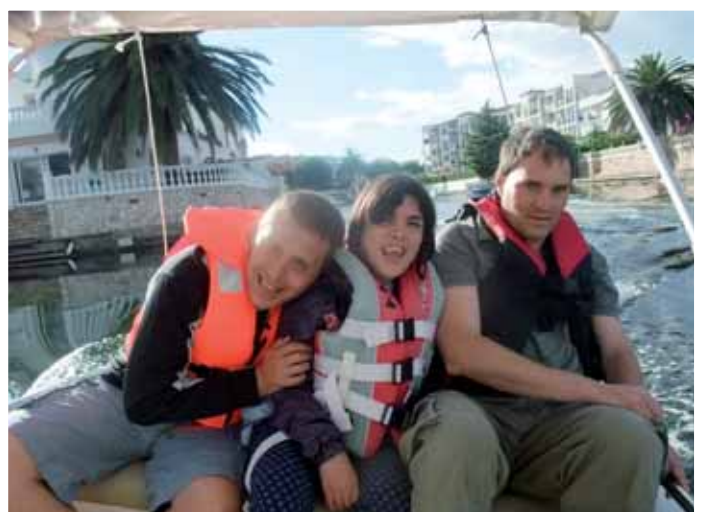
La sortida en vaixell va agradar molt