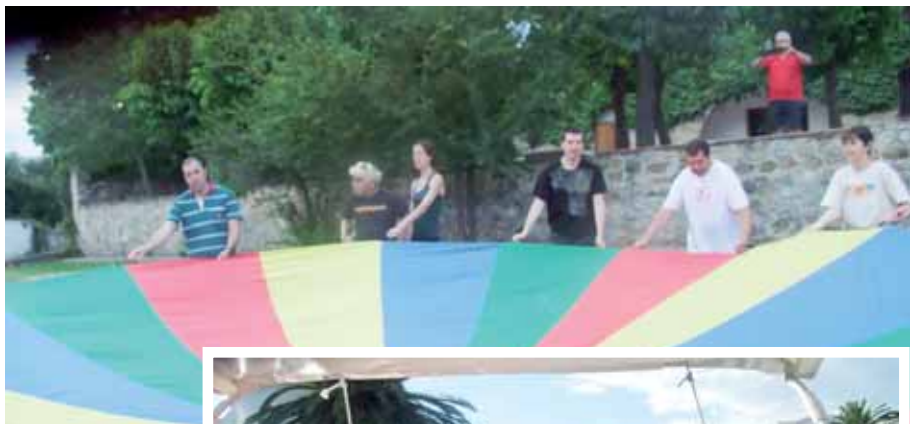
Moment d'una de les activitats a Mas Girçós

D'altra banda, i dins la programació d'activitats d'estiu, un grup de nois i noies de les Llar del Mas van anar d'excursió a Empuriabrava. L'excursió va consistir a visitar la població i a fer un circuit amb vaixell pels canals. Els nois i noies s'ho van passar molt bé, ja que van participar molt de l'activitat: fins i tot algun noi va conduir una estona el vaixell. Era la primera vegada que tenien aquesta experiència i va agradar molt; esperem poder-la repetir. ■