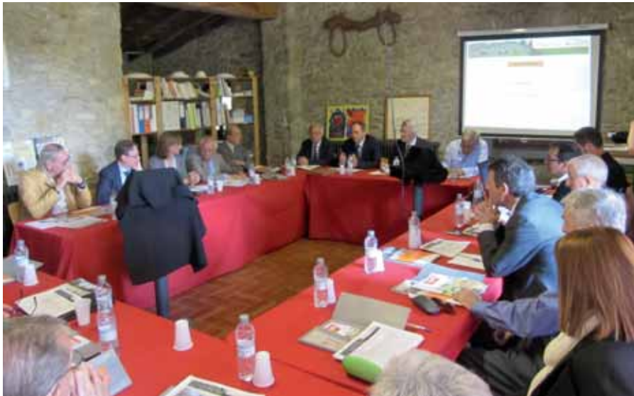
Vista general de la sala