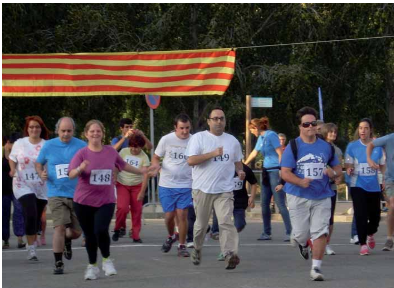
Alguns nois i noies de Mas Casadevall van córrer la II Milla Urbana de Banyoles

Des de la vessant lúdica: setmanalment diversos nois i noies de la residència assisteixen a la piscina del Club Natació Banyoles, el qual ens cedeix gratuïtament les instal·lacions, per fer natació durant l'hivern.