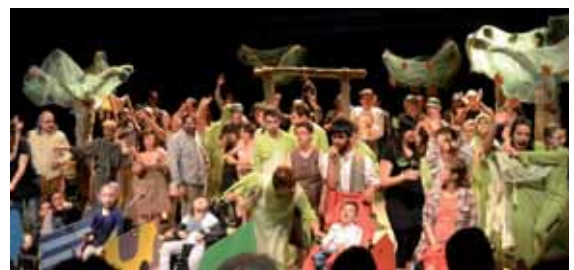
Un moment de la interpretació

Persones amb una discapacitat, amb dificultats neuromotors, diagnosticades de trastorns de l'espectre autista o immerses en una lluita contra la seva addicció. Setanta actors puguen a l'escenari superant barreres i ens representen aquesta història sobre el respecte a la diferència".