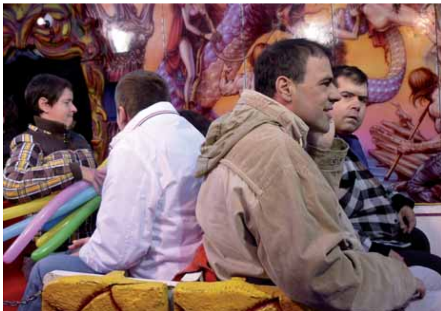
Gaudint de les fires de Banyoles gràcies a la generositat de l'ajuntament i els firaires

Quan llegiu aquestes ratlles ja haurem iniciat la primavera. L'esperem amb ganes i com la majoria, enyorem el bon temps i els dies llargs d'estiu. ■