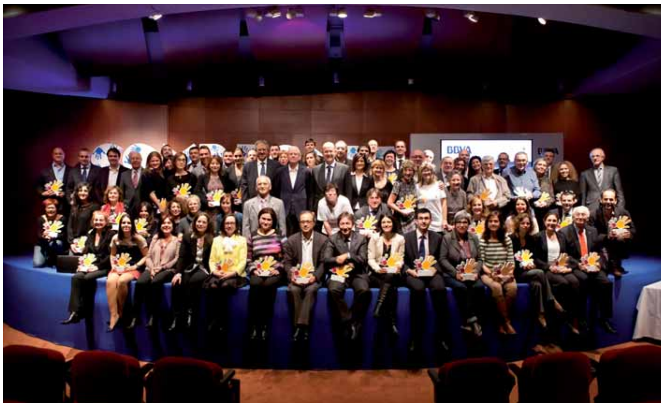
Representants de les entitats seleccionades, amb els directius del BBVA i responsables del programa

Territoris Solidaris, del BBVA, dóna suport als projectes de la fundació