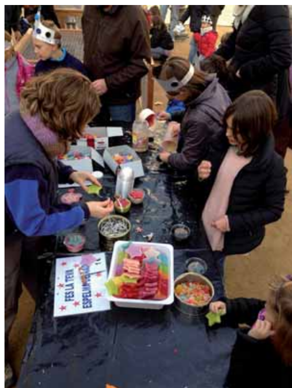
A la Fira de Nadal de Banyoles vam ensenyar als més menuts a fer espelmes

Fins el moment us hem explicat les fires però la cosa va més enllà. Mas Casadevall fa arranjaments d'aparadors per a diades especials. La primera prova es va dur a terme l'any passat en època de flors i es va repetir aquest Nadal a la Plaça Major, a Can Pons. Els nois i noies del Taller de Manipulats varen crear tots els ornaments que feren d'aquell espai un Nadal espectacular.