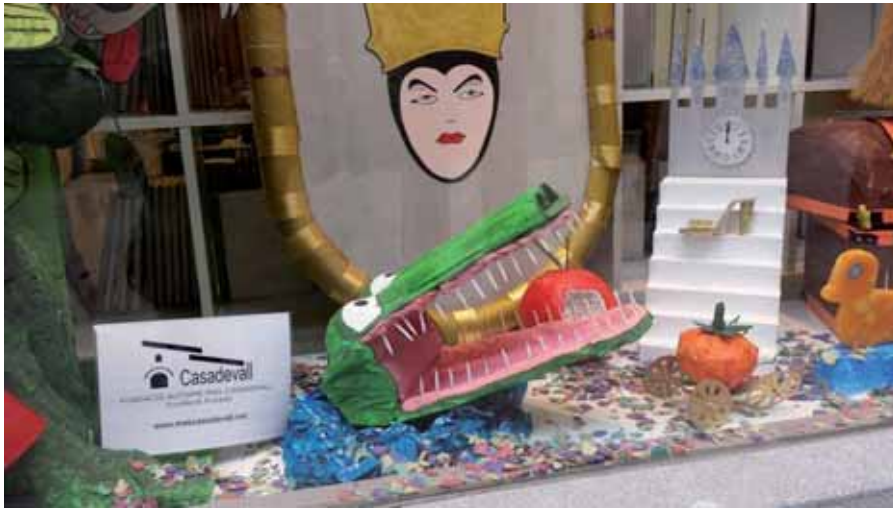
L'aparador de la llibreria l'Altell va quedar així de bonic