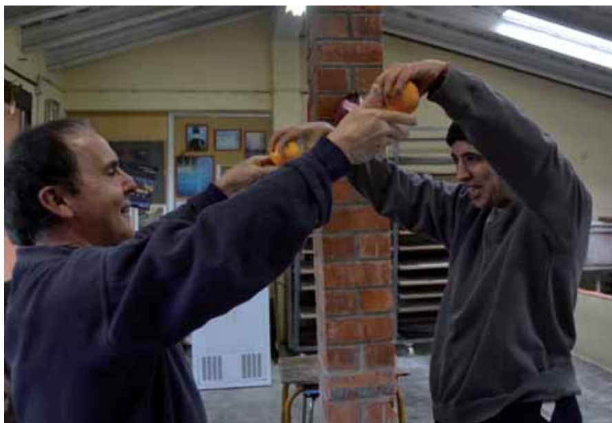
"Capacitats plenes de suc", una iniciativa per celebrar el Dia Internacional de les Persones amb Discapacitat

El tres de desembre, i com a participants de la Taula per a la Discapacitat del Pla