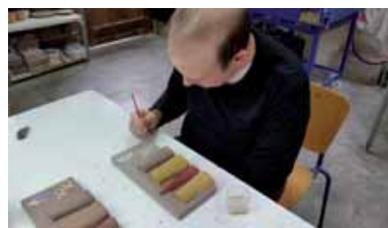
Al taller de ceràmica es van fer les pecs que es van donar en l'acte del 20è aniversari d'Autismo España

Han aconseguit un resultat tan positiu en aquests aparadors que la cosa va a més. Durant el Carnestoltes d'enguany, a la llibreria l'Altell de Banyoles vàrem crear un nou espai màgic. Coincidint amb el lema del Carnaval Banyolí, "Suc de Contes... Hi Havia una vegada", el ta-