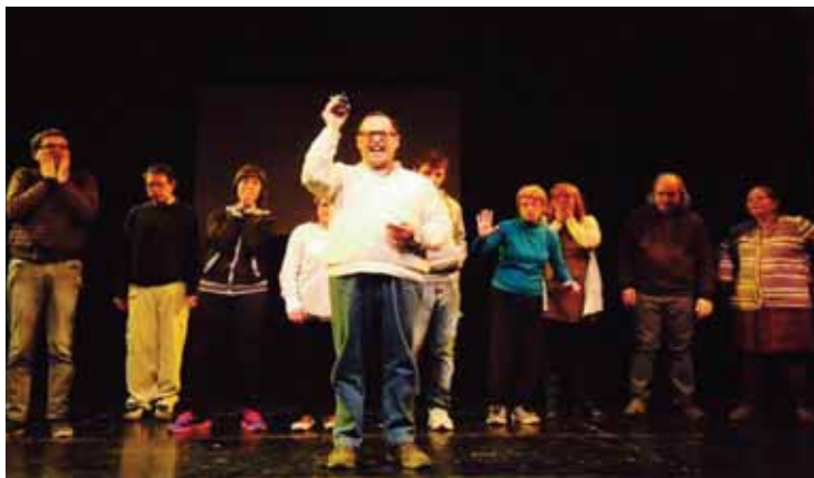
Els nois de la Llar de Banyoles a la representació

Felicitats a tots i totes i PER MOLTS ANYS AL TEATRE MUNICIPAL DE BANYOLES. ■