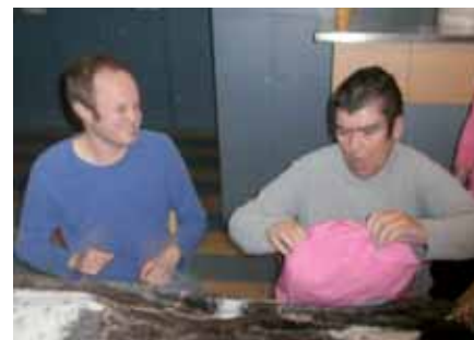
Els nois van desembolicar els regals que va regalar el Tió

part de la diversió que suposa, la relaxació i atenció és veu molt augmentada en tots els assistents.